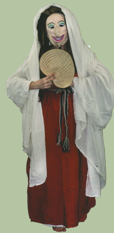
La bourse en cuir